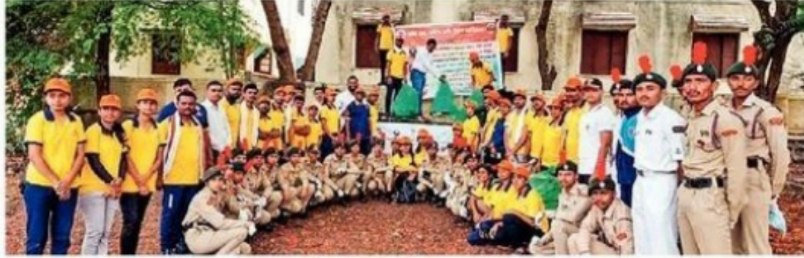
‘स्वच्छ वारी-स्वस्थ वारी-निर्मल वारी-हरित वारी’त वाघिरे महाविद्यालयातील विद्यार्थी.

वाघिरे महाविद्यालयात संत ज्ञानेश्वर महाराज पालखी सोहळ्यातील पालख्या व सावित्रीबाई फुले पुणे विद्यापीठ राष्ट्रीय सेवा योजना विभाग आयोजित राष्ट्रीय सेवा योजनेच्या स्वयंसेवकांची ‘स्वच्छ वारी-स्वस्थ वारी-निर्मल वारी-हरित वारी’ दोन दिवस मुक्कामी होत्या. या दोन दिवसांत महाविद्यालयाच्या